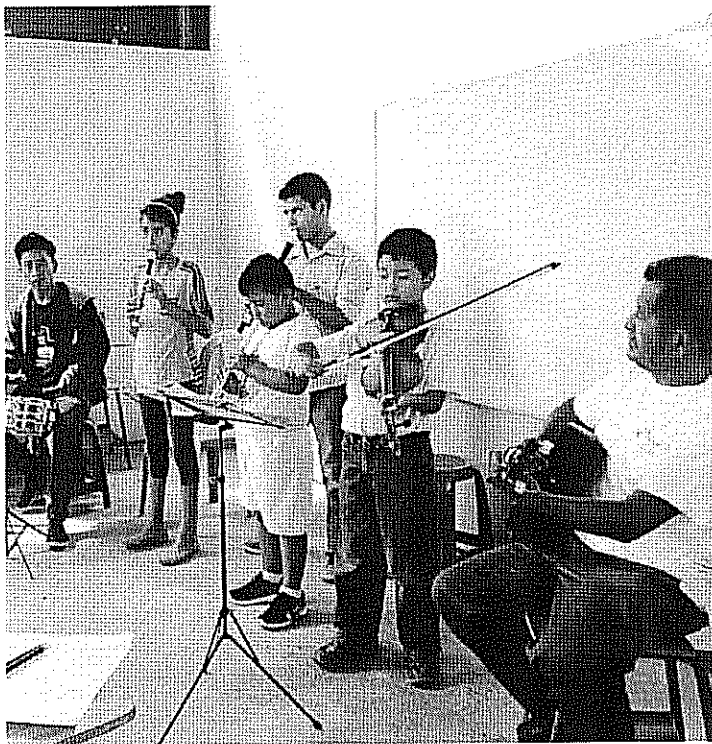
ACTIVIDAD DESARROLLADA Escalas Mayores con sostenidos. realizada el día 09 de Octubre de 2017.