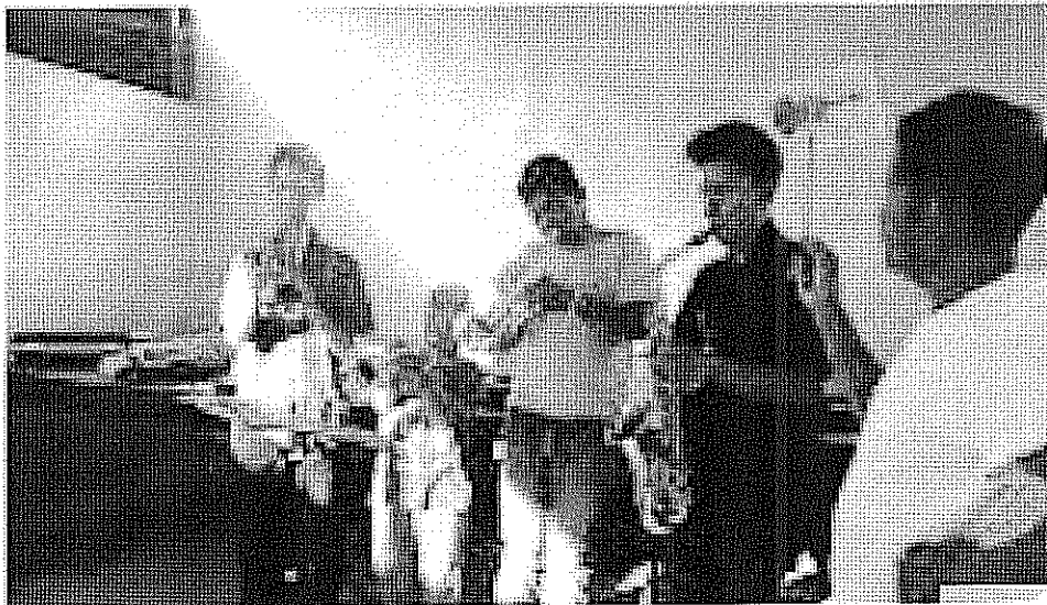
ACTIVIDAD DESARROLLADA Escalas Mayores con Sostenidos. realizada el día 25 de Octubre de 2017.