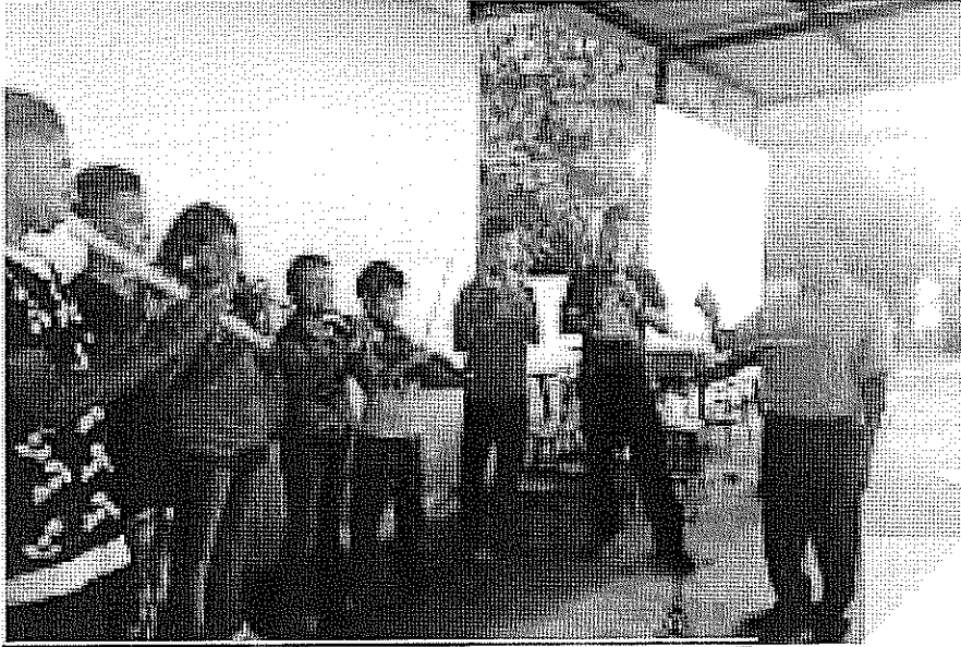
ACTIVIDAD DESARROLLADA Lectura musical. realizada el día 04 de Octubre de 2017.