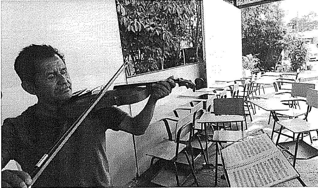
ACTIVIDAD DESARROLLADA Escalas Mayores con Bemoles. realizada el día 16 de Octubre de 2017.