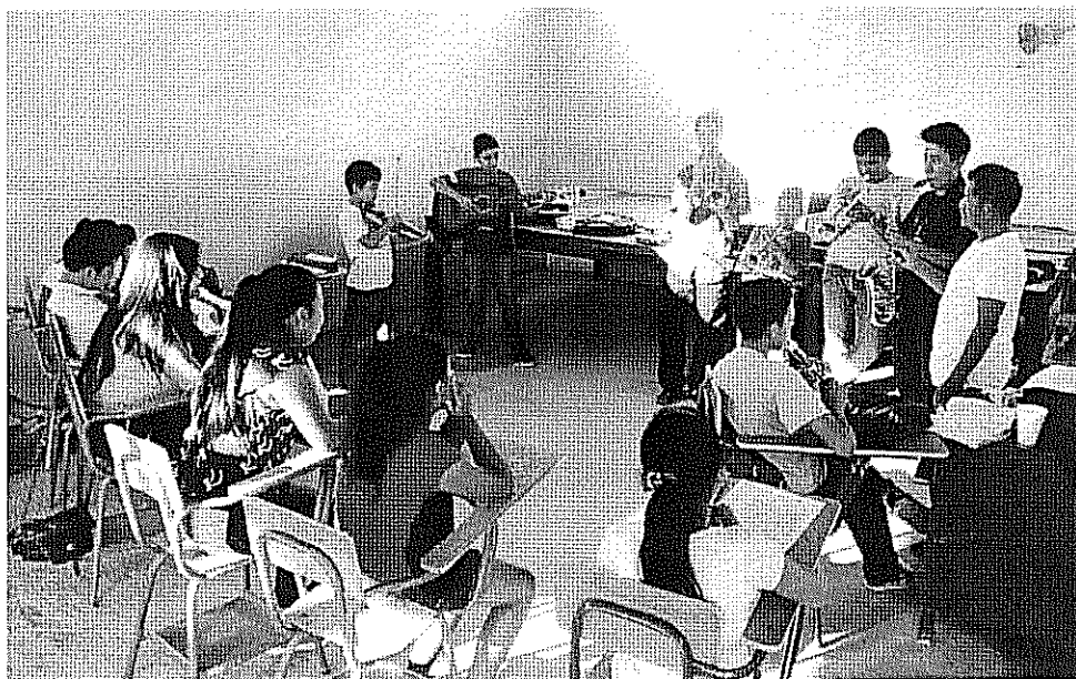
ACTIVIDAD DESARROLLADA Escalas Mayores con Bemoles. realizada el día 31 de Octubre de 2017.